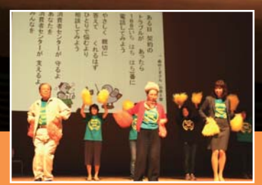
SasaL(ササエル)によるオープニング