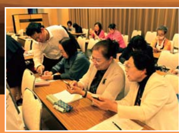
分科会にてスマホを手に学習