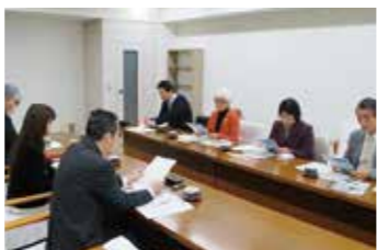
12月21日(木) 日本共産党県議団の皆様と懇談