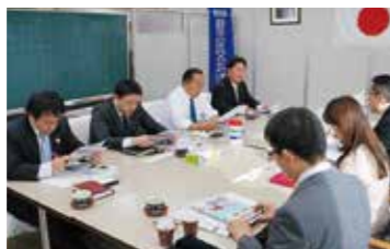
12月5日(火) 無所属県民会議の皆様と懇談