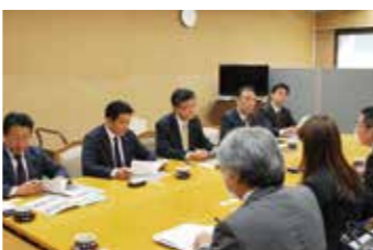
12月6日(水) 公明党議員団の皆様と懇談