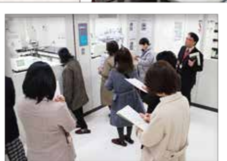
日本生協連商品検査センターを見学しました