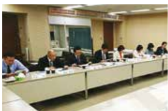
12月18日(月) 民進党・無所属の会の皆様と懇談