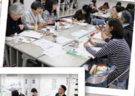
卒業生の皆さんの近況や今後してみたいことなどを交流しました

2月15日(木)、コープみらいカレッジ埼玉校卒業生の同窓会を開催し、52人(卒業生34人、地域で活動するブロック委員など18人)が参加しました。同窓会は卒業後のつながりを大切に、近況報告や交流と合わせて、日本生協連の商品検査センターの見学をおこないました。卒業生から、コープみらいカレッジで学んだことを活かし、地域の中での自分なりの関わり方を模索し、一緒に学んだ仲間とのつながりを大切に活動していることなどが報告されました。