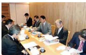
12月11日(月) 自民党議員団役員の皆様と懇談

埼玉県生協連の2017年の主な取り組み・会員生協の組合員数と事業概要・県政要望として提出した消費者契約法の一部改正・子どもの貧困・フードバンク・災害対策等を紹介し、意見交換しました。