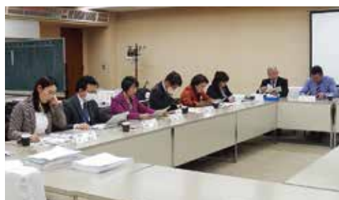
▲12月17日(月) 立憲・国民・無所属の議員の皆様との懇談会