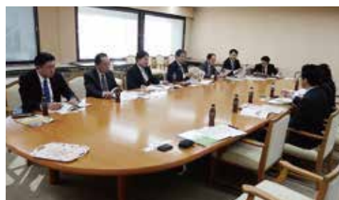
▲12月17日(月) 無所属県民会議議員の皆様との懇談会