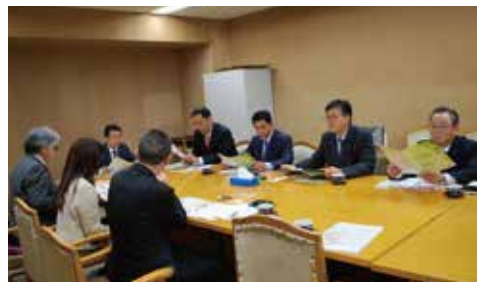
▲12月21日(金) 埼玉県議会公明党議員団の皆様との懇談会