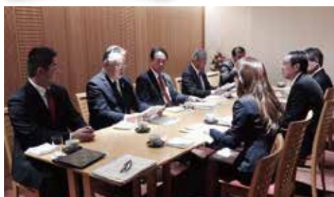
▲12月5日(水) 埼玉県議会自由民主党議員団役員の皆様との懇談会

埼玉県生協連と会員生協の事業状況やSDGsの視点からみた会員生協の活動紹介、県政要望として子どもの貧困、フードバンク、協同組合連携などについて紹介、意見交換しました。