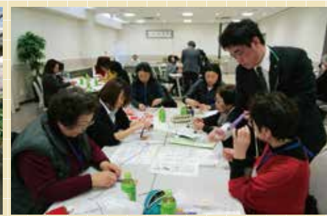
▲防災プレスレットづくり