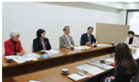
▲12月20日(木) 日本共産党埼玉県議団議員の皆様との懇談会