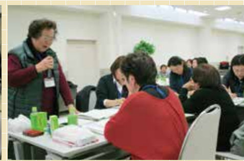
▲グループごとに交流報告しました