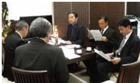
▲12月17日(月) 無所属改革の議員の皆様との懇談会