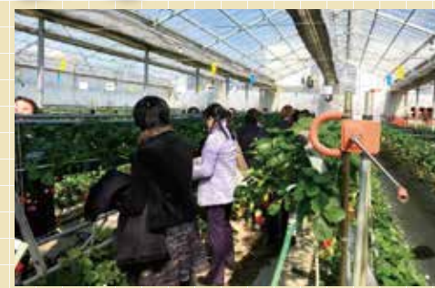
▲紅ほっぺやあきびめを堪能しました

協同組合間の交流の場として、24回目を迎えた今年は、むさしの村を会場にいちご狩り、防災プレスレットづくり、各団体の活動報告の後、6つのグループごとに日ごろの活動や「食品等の商品開発について」意見交換や交流をおこないました。