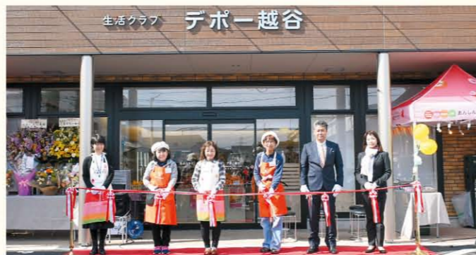
関係者によるテープカット