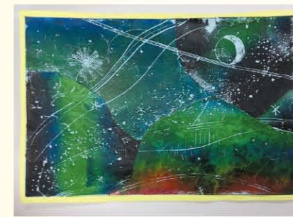
埼玉県知事賞 「不思議な森」