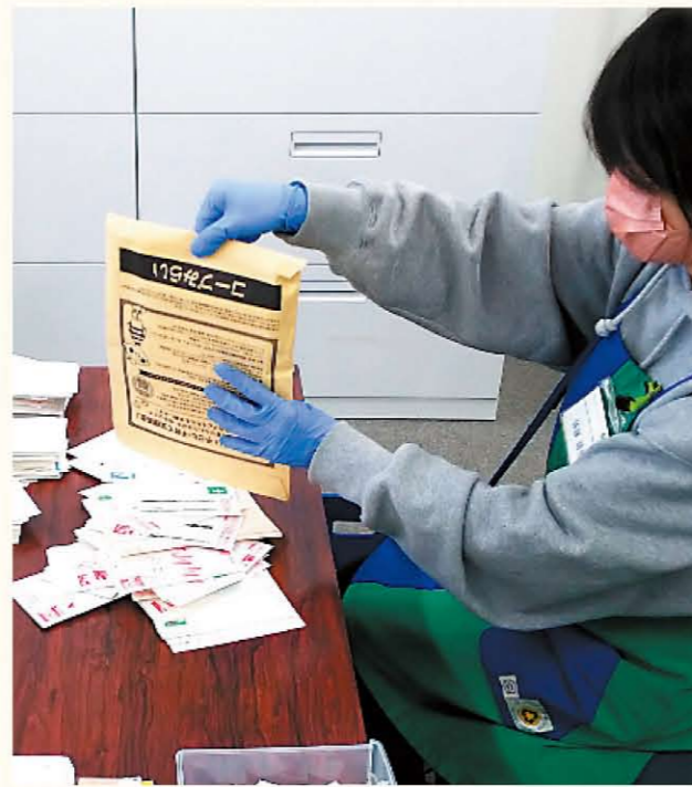
回収・換金作業の様子。1月17日週に「回収専用封筒」を配布し、多く寄贈いただいています