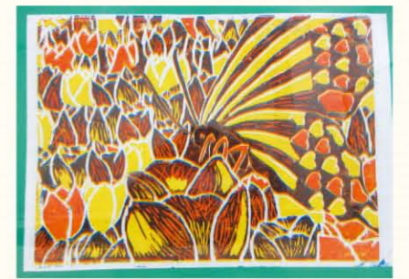
こくみん共済 coop 埼玉推進本部長賞 「至福の時」

こくみん共済 coop<全労済>では、社会貢献活動の一環として子どもたちの豊かな心の成長を願い、1973年から小学生を対象に作文・版画のコンクールを開催し、今回で48回目を迎えています。埼玉県内の小学生から作文・版画の両部門あわせて506点の応募をいただき、埼玉県知事賞、こくみん共済 coop 埼玉推進本部長賞をはじめとした各賞を選定しました。なお、2月26日(土)に予定した表彰式は、新型コロナウイルス感染症拡大の影響を考慮して中止しました。