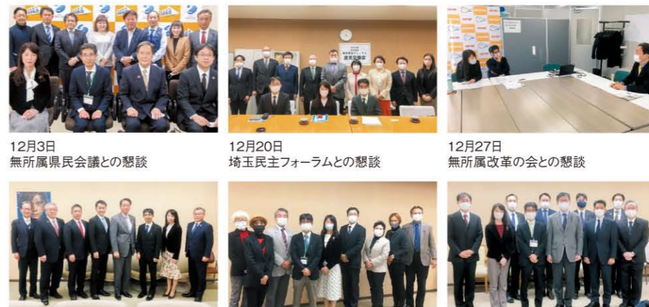
12月3日 無所属県民会議との懇談 12月20日 埼玉民主フォーラムとの懇談 12月27日 無所属改革の会との懇談 1月5日 埼玉県議会自由民主党議員団役員との懇談 1月11日 日本共産党埼玉県議会議員団との懇談 1月17日 埼玉県議会公明党議員団との懇談

生協への理解を深め、意見交換を行う場として埼玉県議会6会派37人の県議会議員と懇談しました。新型コロナウイルスの感染が続く中で県内生協の事業状況、フードドライブ、健康づくりや消費者被害防止の取り組みなどを中心に懇談をおこないました。