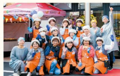
デポーの運営を受託する「ワーカーズコレクティブ ぶくの輪」のみなさん

3月4日(金)に、生活クラブ生協埼玉で第3号店となるお店、「デポー越谷」がオープン。組合員・職員、大勢の力を結集し、目標1000人の仲間づくりも達成しました。店舗ではオリジナルの食材・生活用品の販売だけでなく、サステイナブルな暮らし方を発信します。コロナ禍で活動自体が難しいですが、今後は地域に根差し、地域課題に取り組むまちづくりも進めていきます。