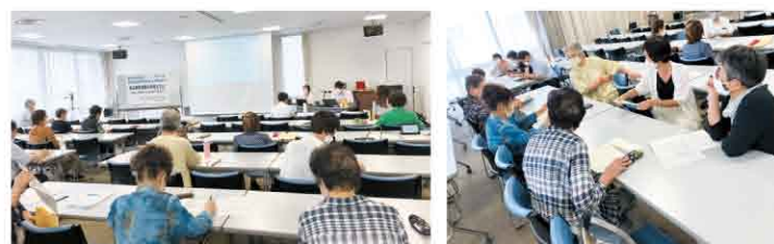
会場とZoomで参加いただきました