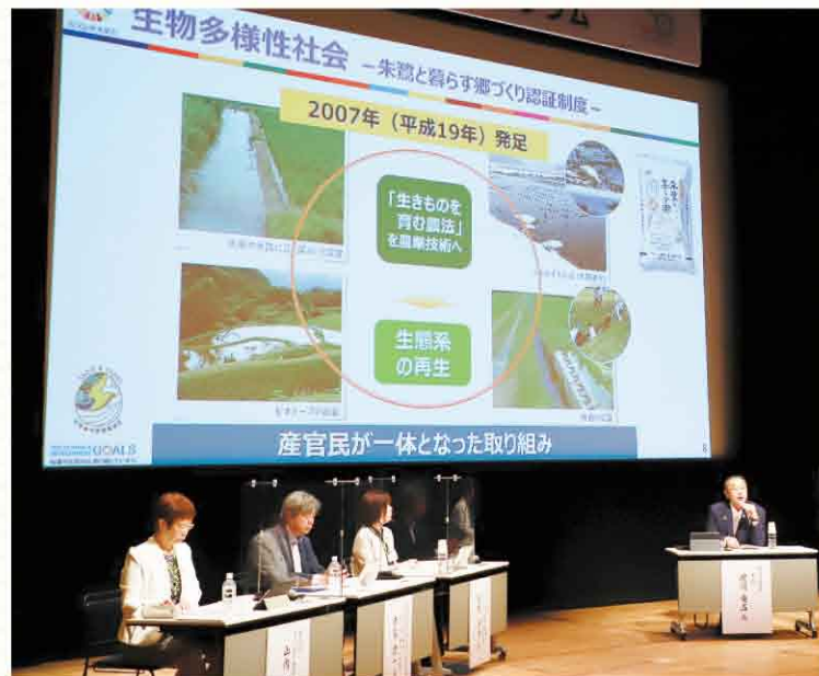
東京・よみうり大手町ホールで開催し、会場とオンライン合わせ、400人近い方々にご参加いただきました