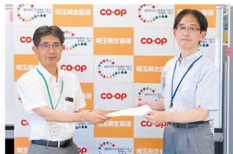
県への要望書をお渡ししました