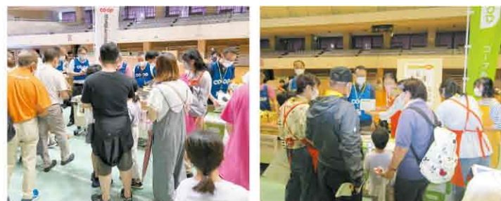
救援物資配布訓練