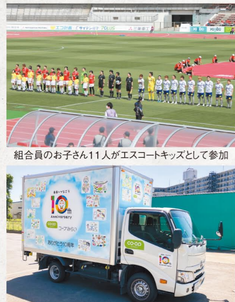
組合員のお子さん11人がエスコートキッズとして参加