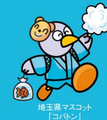
埼玉県マスコット 「コバトン」