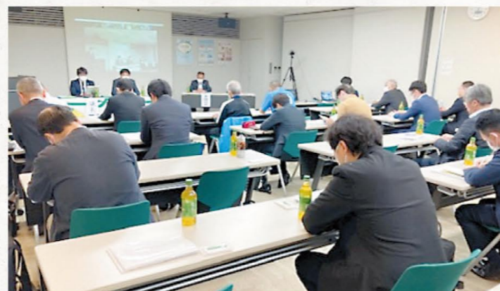
組合員討議集会(さいたま地区会場)

こくみん共済 coop 埼玉推進本部では7月28日に開催する第6回組合員代表者会議に向けて、5月17日から5月29日まで、県内14地区において組合員討議集会を開催し、2022年度推進活動計画進捗報告、2023年度推進活動計画(案)、各地区推進活動計画等について協議し、確認されました。