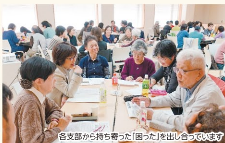
各支部から持ち寄った「困った」を出し合っています

一人ひとりが持つ「困った」に応える活動を始めました。11月の地域別総代会議では1092件の「困った」事例が出され、それらを9つのカテゴリーに分類しました。多くの人に共通する「困った」を「安心」に変えるために生協ができることを今後模索します。