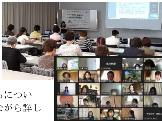
会場およびオンラインで開催しました