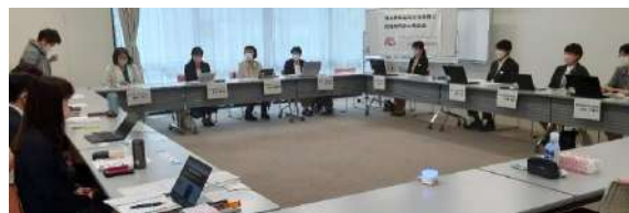
今年は対面で開催しました

*HACCP…食品等事業者自らが食中毒菌汚染や異物混入等の危害要因(ハザード)を把握した上で、原材料の入荷から製品の出荷に至る全工程の中で、それらの危害要因を除去又は低減させるために特に重要な工程を管理し、製品の安全性を確保しようとする衛生管理の手法