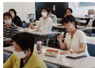
会場での質疑応答のようす