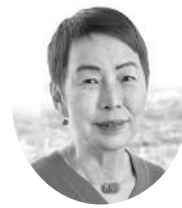
上野 千鶴子 氏 社会学者・東京大学 名誉教授・認定NPO 法人ウィメンズア クションネットワーク (WAN) 理事長