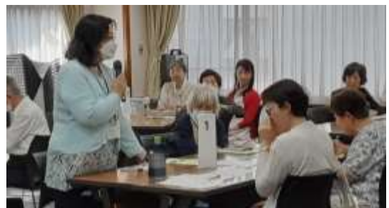
5グループで地域で何ができるか考え合いました