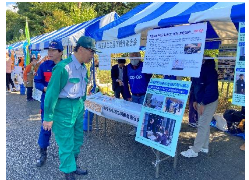
【防災フェアの視察で生協連ブースに立ち寄った大野知事】

10月20日(日)に第45回九都縣市合同防災訓練(埼玉県会場)が日高市総合公園で行われました。今回は、関東平野北西縁断層帯(深谷断層・綾瀬川断層)を震源とするマグニチュード8.1の地震が発生し、日高市内では最大震度6弱の揺れを観測するとともに、大な被害が発生しているとの想定のもと、消防、警察、自衛隊、九都縣市、防災関係機関、医療機関、災害時応援協定締結事業者、自主防災組織などが連携して、訓練を行いました。