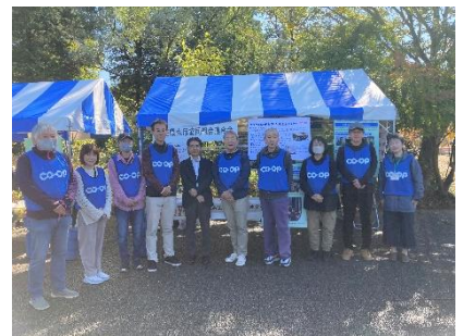
災害対策委員会メンバーが訓練参加