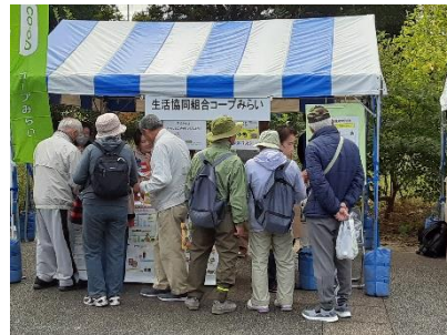
コープみらいブース